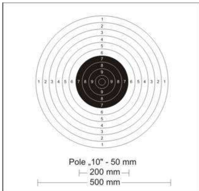
Tarcza do strzelań w konkurencji pistoletu dowolnego i pistoletu sportowego (strzelanie dokładne). Odległość strzelania – 50 m (pistolet dowolny), 25 m (pistolet sportowy).